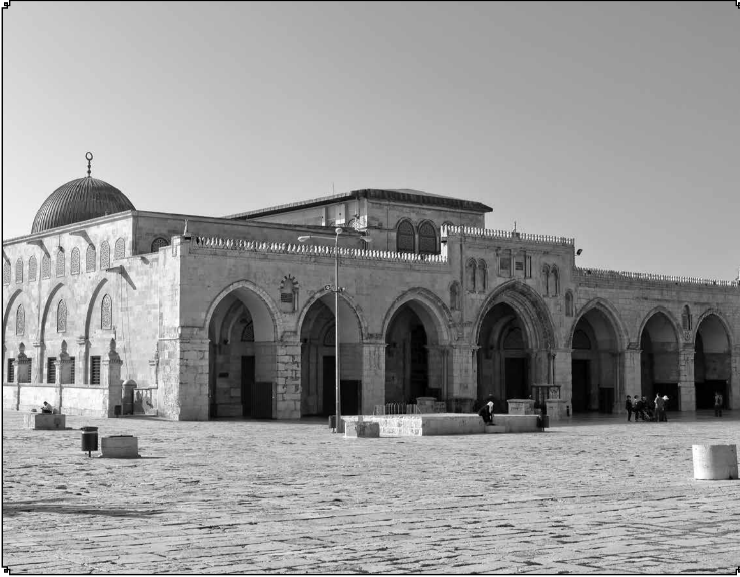
Мечеть Аль-Акса.

Чтобы понять статус Иерусалима в глазах и сердцах верующих, необходимо обратиться внимание на историю этого куска земли. Центральным аспектом этого вопроса является роль мечети аль-Акса.