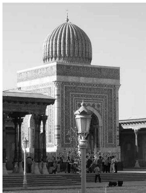
Меориал Имама Бухари в Самарканде.